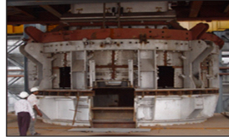
Heavy Equipment Erection