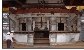
Heavy Equipment Erection